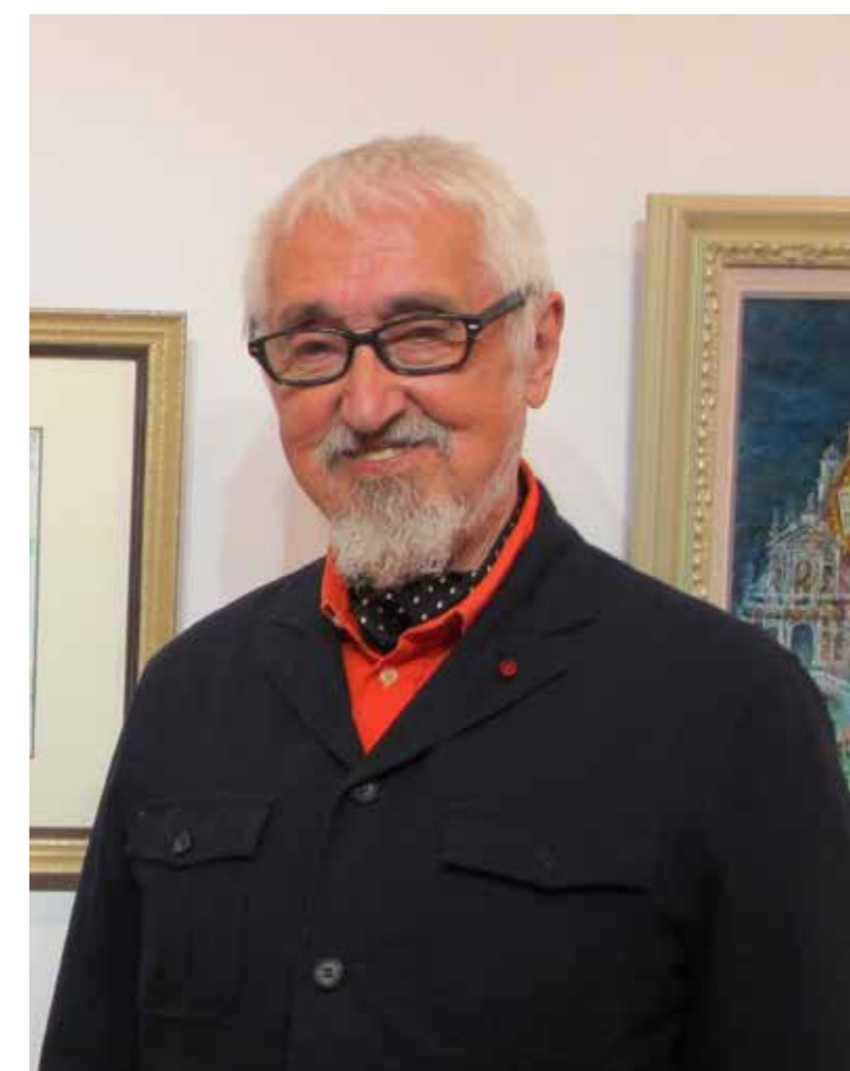
ミハエル・クーデンホーフ・カレルギー氏

1937年、チェコのプラハ生まれ。日本人クーデンホーフ光子を祖母に、現EUの基盤「パン・ヨーロッパ運動」の提唱者リヒャルト・クーデンホーフ=カレルギーを伯父に持つ。エルNST・フックスをはじめ、ウィーン幻想派を代表する芸術家たちからの助言を受け、同派の中心的存在として活躍した後、独自の世界観を発展させた。日本とオーストリアの文化の架け橋となり、2013年にはオーストリア共和国大統領よりプロフェッサーの称号を受ける。2018年には科学芸術功労十字章一等級を授与されるも同年12月に帰天。