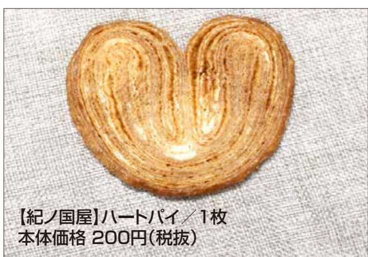
【紀ノ国屋】ハートパイ 1枚 本体価格 200円(税抜)

自分用、友人に手軽に渡せるスイーツから本格的なギフトまでバラエティ豊かにご用意します。おすすめは紀ノ国屋自家製のスイーツ。見た目もかわいらしいハート型のパイ、スイートチョコとチョコチップがザクザク入った風味豊かなチョコクッキーなど、紀ノ国屋のオリジナルの味わいをご用意してお待ちしております。