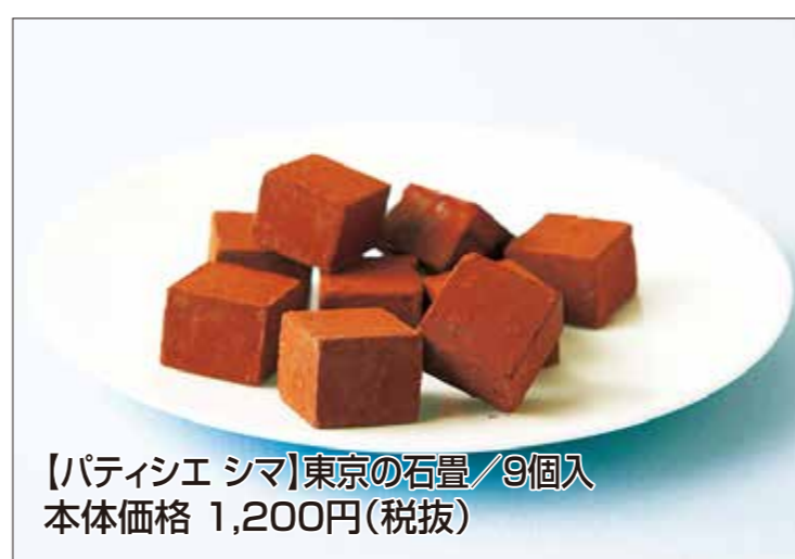
【パティシエ シマ】東京の石畳/9個入 本体価格 1,200円(税抜)