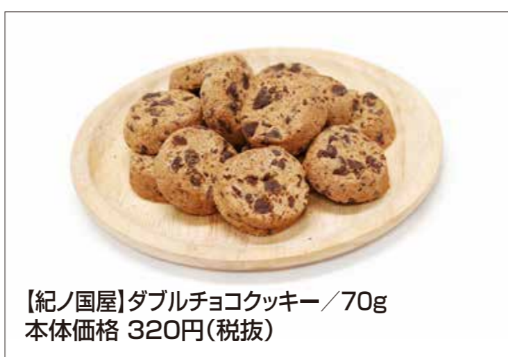
【紀ノ国屋】ダブルチョコクッキー/70g 本体価格 320円(税抜)