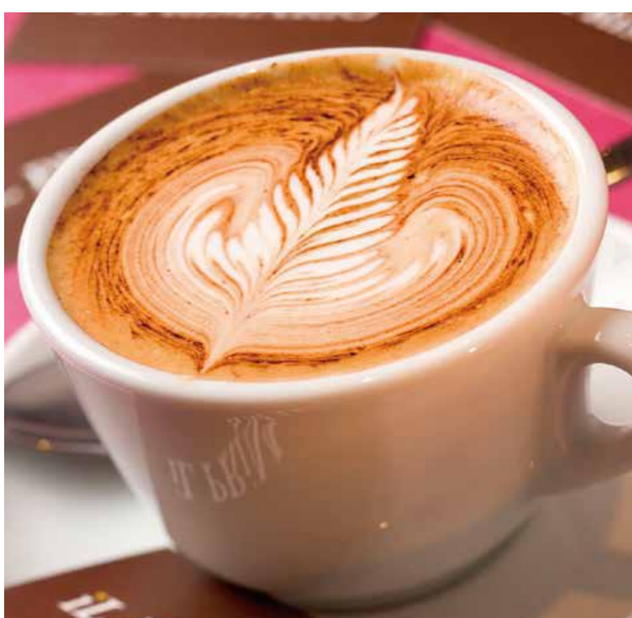
B1 iL PRiMARiO イルプリマリオ

※詳しいセール期間や内容は各店にお問い合わせください。※内容は予告無しに変更する場合があります。