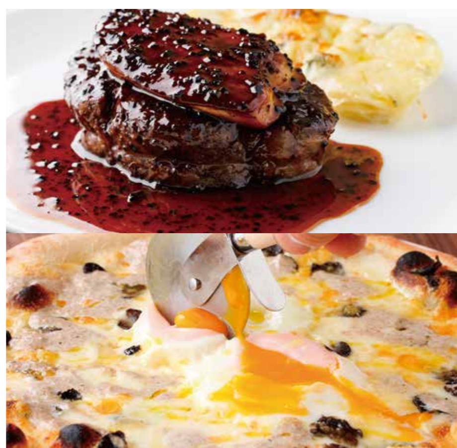
1F 俺のフレンチ・イタリアン 俺のフレンチ・イタリアン 青山