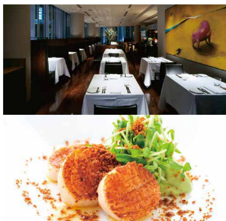
5F TWO ROOMS GRILL | BAR トゥールームス グリル | バー