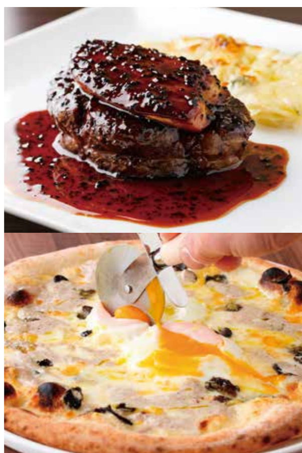
1F 俺のフレンチ・イタリアン 青山