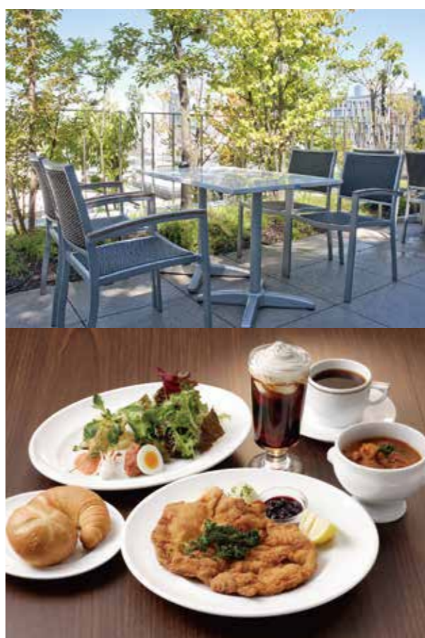
4F CAFE LANDMANN 青山店