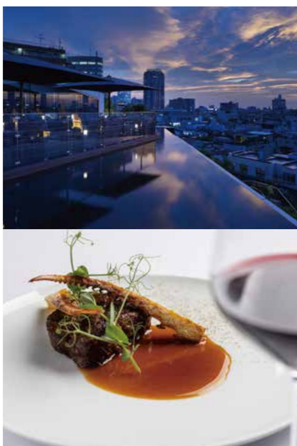
5F TWO ROOMS GRILL | BAR