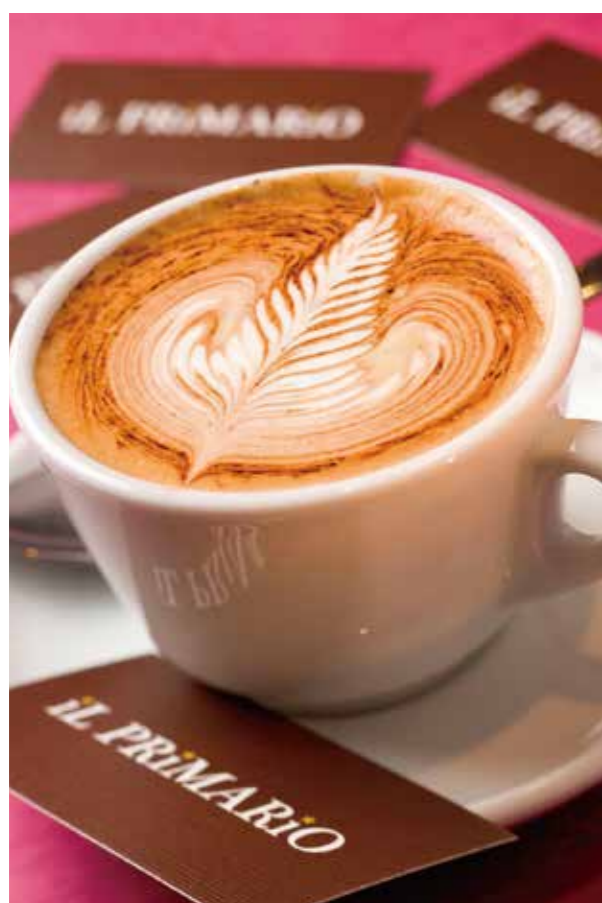
B1 il PRIMARIO イルプリマリオ

※詳しいセール期間や内容は各店にお問い合わせください。※内容は予告無しに変更する場合があります。