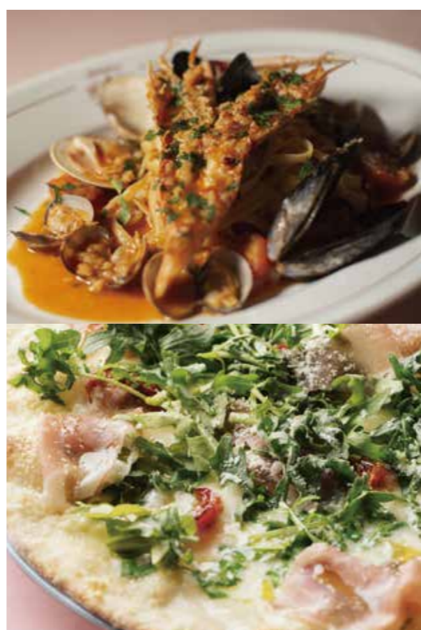
2F La Terrazza SABATINI 表参道